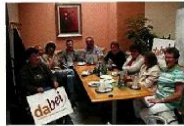
„Caféhaus-Gespräche“ im Eiscafé Mattiuzzi