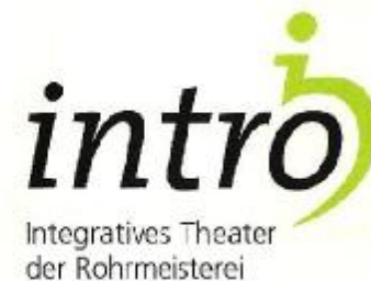
Theater-AG „intro“ für Kinder mit und ohne Behinderung