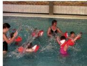
Reha-Schwimmgruppe „Wasserteufel“ für Kinder mit Behinderung